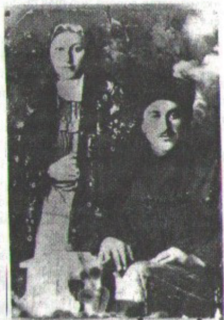
შობლები. XX საუკუნის 20-იანი წლები. Родители. 20-тые годы XX-го столетия.

То, что мы местные и грузины, подтверждает следующий факт. Взять наше село Тоба. Само слово «Тоба» означает по-грузински «озеро». И на самом деле Тоба - это озеро. В двух-трех местах есть источники, родники. Одно место мы называли «чанчаха» - это тоже грузинское слово, означает «ледяной», вода там действительно была ледя-