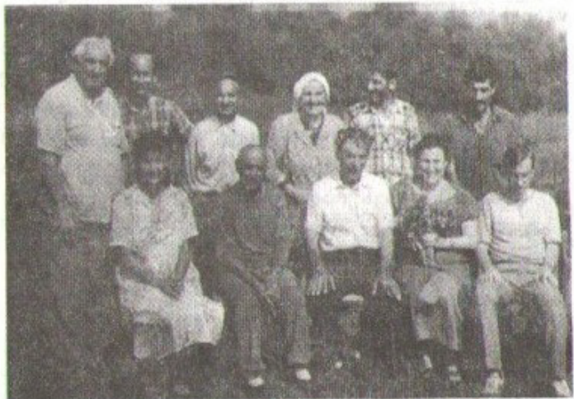
ნასაკირალელ მესხებთან, 1992 წელი. У Насакиралских месхов, 1992 год.