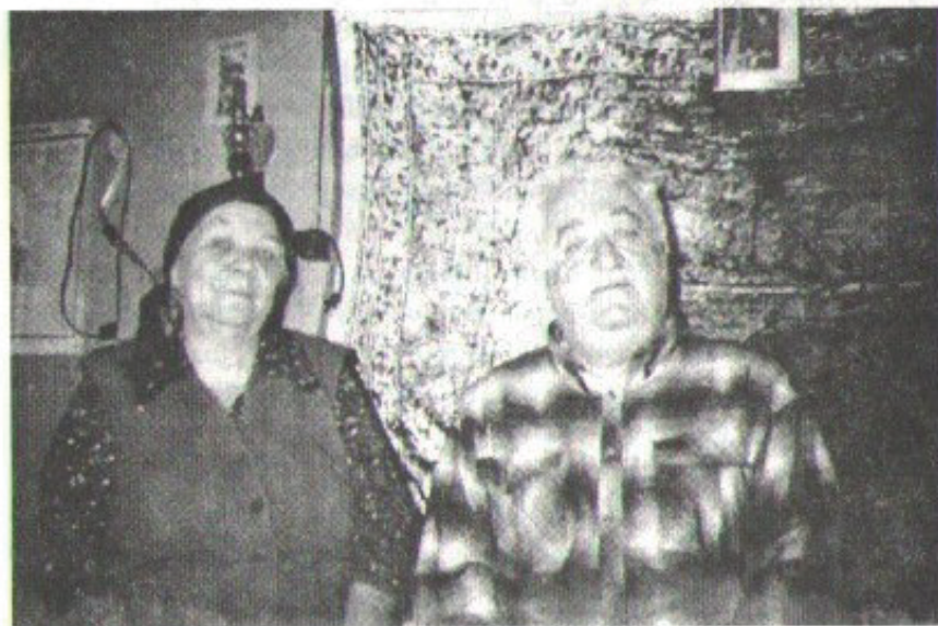
მეუღლესთან ერთად. 1999 წელი, გლდანი. С женой. 1999 год, Глдани.