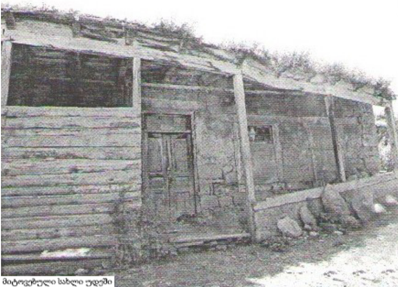
მიტოვებული სახლი უდგები

დაფასებისა და პატივისცემის სხვადასხვა ფორმებით ახლაც სარგებლობენ. მაგალითად, სუფრაზე ასაკით უფროსს ყოველთვის პირველი ადგილი ეკუთვნის. ახალგაზრდა კაცი არასდროს ჯდება საპატიო ადგილზე, რადგანაც თუ მოულოდნელად პატივისცემი ადამიანი გამოჩნდებოდა, ახალგაზრდა იძულებული იქნებოდა, მისთვის შეუფერებელი საპატიო ადგილიდან გადაეხადარიყო. ეს კი მას ჩვეულებების უცოდინარი ადამიანის დაღს დაასვამდა. და ეს არანაირად არ იყო იმაზე დამოკიდებული, ვინ კათოლიკე იყო და ვინ მაჰმადიანი.