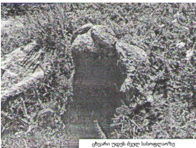
ცხვარი უდეს ძველ სასოფლაოზე

1900-1908 წლებში უდელებმა კათოლიკეებმა სოფელში ეკლესია ააშენეს. უდეს მაჰმადიანელთა იმამმა ეიუბ ჭილაშვილმა ამასთან დაკავშირებით თავის ქადაგებაში მეჩეთში განაცხადა, ეკლესიაც და მეჩეთიც უზენაესის სავანეა და ნებისმიერი ადამიანი, რომელიც ეკლესიის აშენებას დაეხმარება, სახელდობრ კი, საშენ ქვას ზურგით აიტანს ეკლესიის მთაზე, «სავაბს» (ღვთის სასურველ საქმეს) დაიმსახურებს. თითქმის იმავდროულად