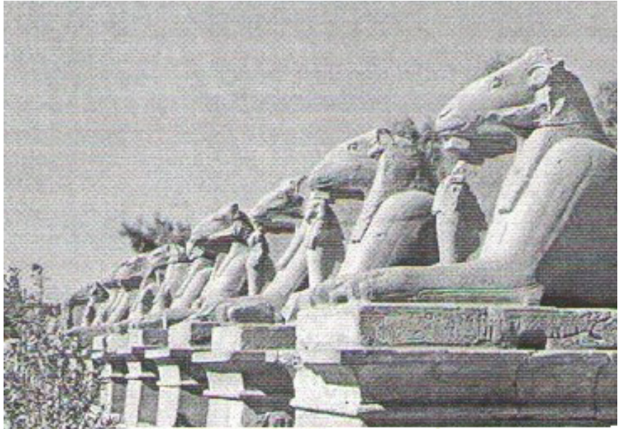
სფინქსები ეგვიპტეში, კარნაკის ტაძართან