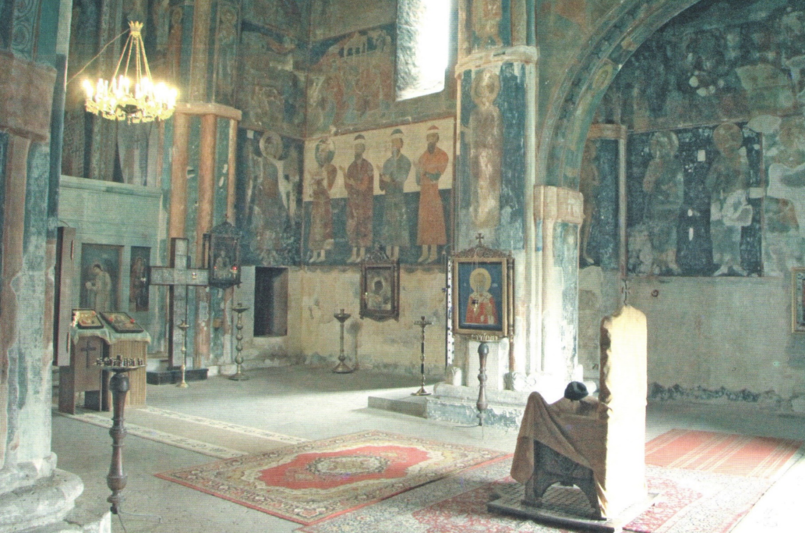
ზარზმის მამათა მონასტერი. ეკლესიის ინტერიერი

ერთ-ერთი მათგანი იმის შესახებაა, რომ აქ თურქები ცხოვრობდნენ, ისინი 1944 წელს გასახლეს და სწორადაც მოიქცნენო. დეპორტაციის შემდეგ განვლილ თითქმის 70 წელიწადში საბჭოთა პროპაგანდისტულმა მანქანამ თავისი საქმე გააკეთა - მოსახლეობის უმრავლესობა დარწმუნებულია, რომ ისინი “საქმისთვის” გადასახლეს: რადგან თურქეთის საზღვარი აქვე, გვერდით იყო, თურქები ყველანაირად ვნებდნენ საბჭოთა ხელისუფლებას და ამ მხარის მცხოვრებთ დაუსახეს ამოცანა - თავი შეაკალით და არც ერთი მათგანი არ შემოუშვათ უკანო. და ასევე ხდება. ნებისმიერ უცხო ადამიანს, რომელიც ამ მხარეში გამოჩნდება, გამლიერებული ყურადღებითა და ეჭვით ეკიდებიან. ეს კი სამწუხაროა, რადგანაც ფუჭდება ბუნებით მიმნდობი და გულლია ქართული ხასიათი.