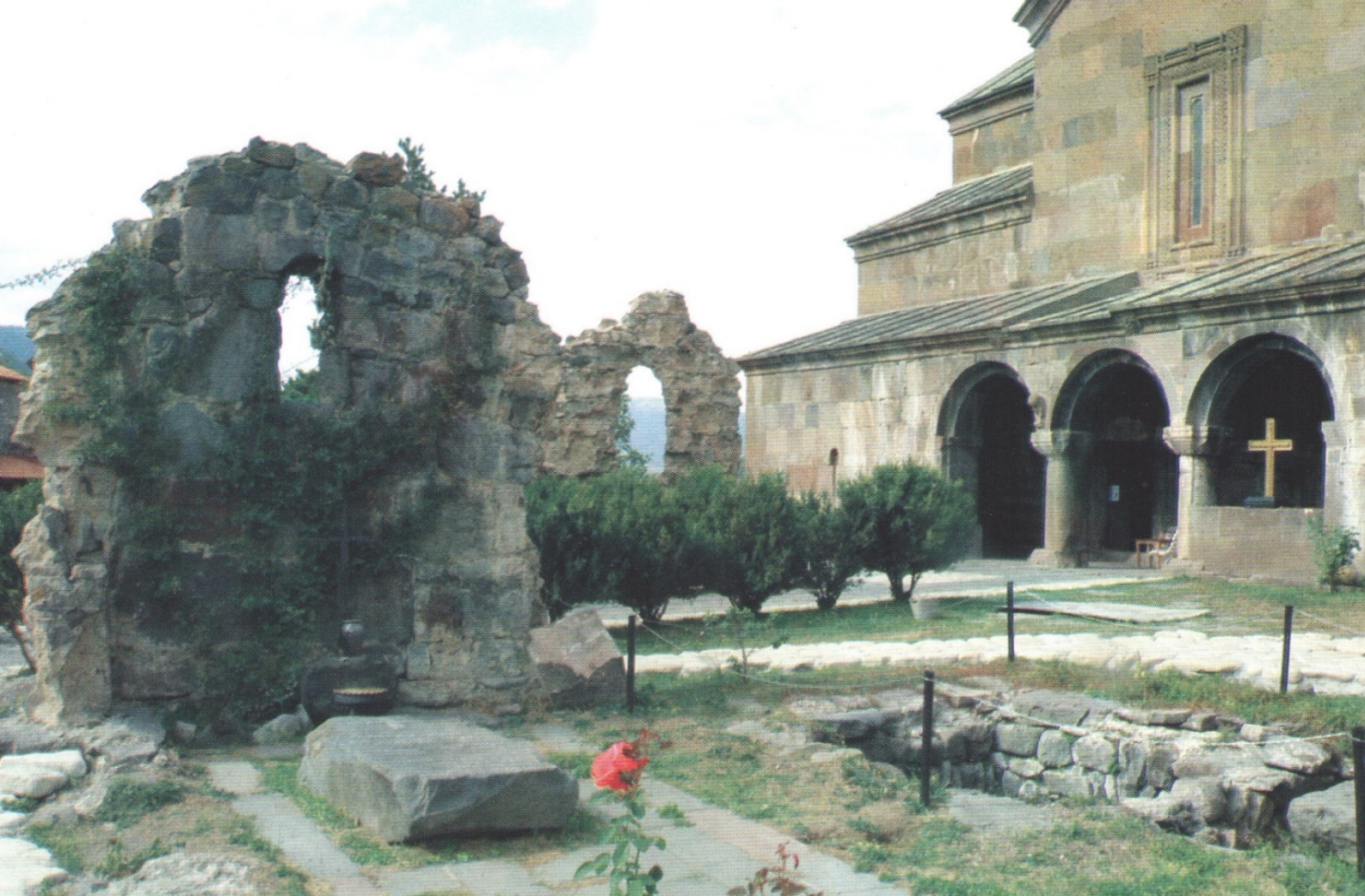
X საუკუნის ეკლესიის ნანგრევები

თუ მოციცქნის და თოვლივით ქათქათა ხელსაწმენდს შეეხება. ის, როგორც გულითადი მასპინძელი და ზრდილობიანი ადამიანი, უხმოდ უსმენს სტუმარს. თუმცა ვითომ საჭიროა რუსეთის ტახტის მემკვიდრის დარწმუნება ზარზმის ტაძრის სილამაზეში? მან ხომ დიდი ხანია იხილა და შეიყვარა იგი. და განა ახალი ტაძარი, რომელიც მან აბასთუმანში ააგო, და რომელიც ნესტეროვმა უნდა მოხატოს, ზარზმის ასლი არ არის?