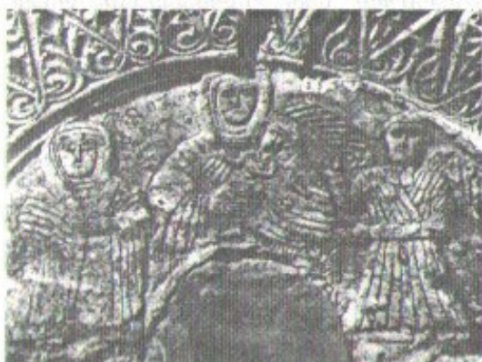
ვალეს ეკლესია. აღმოსავლეთის ფასადის რელიეფი. ღვთისმშობელი

როგორი იყო მოსახლეობის რიცხოვრივი შემადგენლობა მესხეთში ომამდე? როგორი ცვლილებები მოხდა მას-